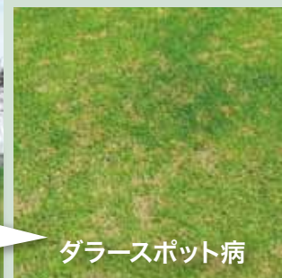
ダラースポット病